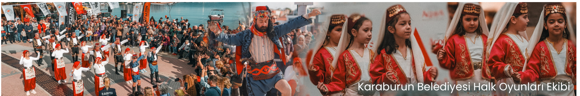
Karaburun Belediyesi Halk Oyunları Ekibi

www.karaburun.bel.tr adresimizden dijital gazetemizi takip ederek en güncel haberlere ulaşabilirsiniz.